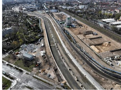
Landnutzung und Bebauung